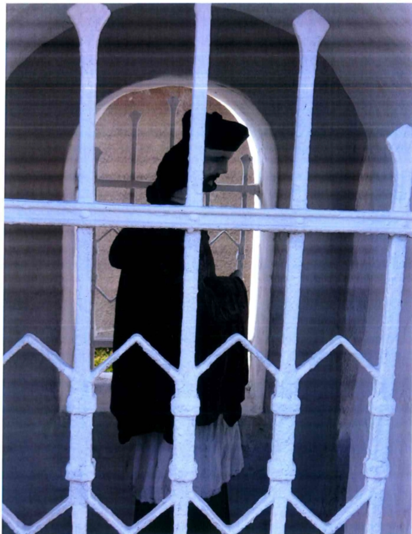
Figura Św. Jana Nepomucena z końca XIX w. Kapliczka domkowa ul. Rolników 328 Dz. nr 200.