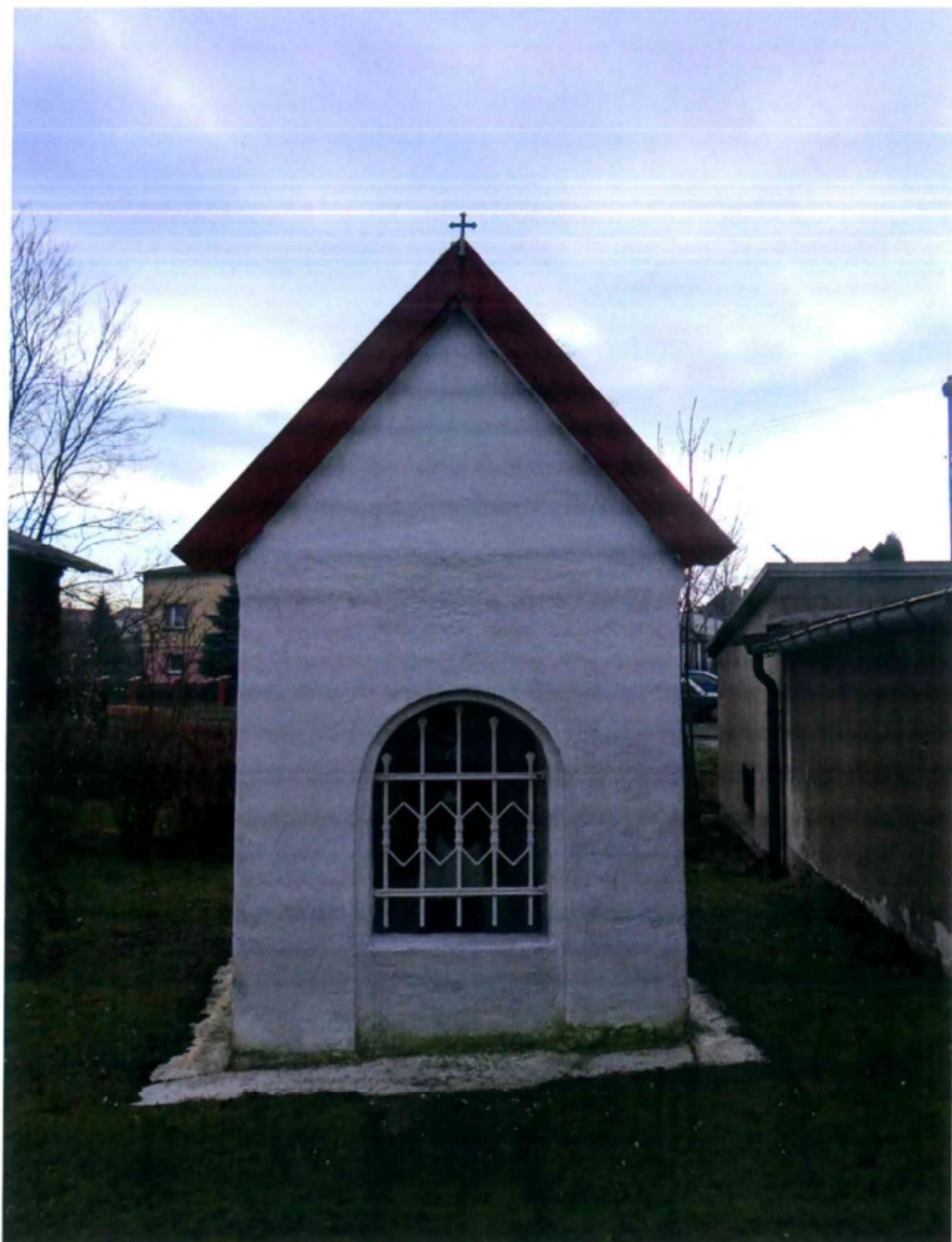
Kapliczka domkowa Św. Jana Nepomucena. Rok budowy koniec XIX w. Ul. Rolników 328.