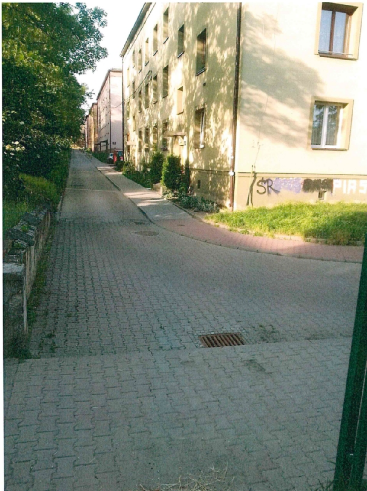
Widok od ulicy Ligonia przy Szkole Podstawowej nr 10 w kierunku wjazdu przy numerze 83.