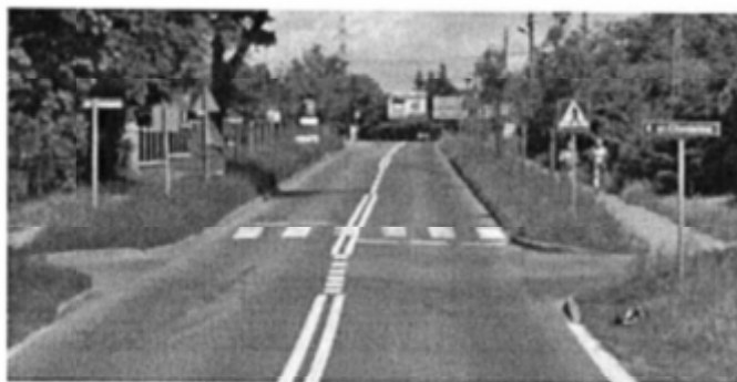
Rys2. Obecne przejście dla pieszych