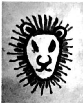
Nasza propozycja znaku.

Podobny szlak (szlak Sowy – Parcours de la chouette) funkcjonuje z ogromnym sukcesem we francuskim mieście Dijon (zdjęcia poniżej).