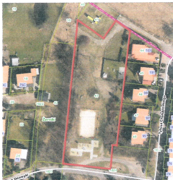
FOTO 1 : Teren planowanej inwestycji

Przedmiotem opracowania jest przedstawienie koncepcji zagospodarowania terenu, budowy placu zabaw dla dzieci wraz z boiskiem do gry w piłkę plażową przy ul. Chałubińskiego / Domeyki w ramach Budżetu Obywatelskiego.