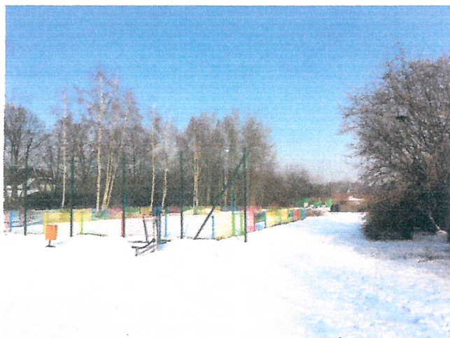
FOTO 2 : Zdjęcie terenu planowanej inwestycji

Teren inwestycji znajduje się w miejscowym planie zagospodarowania przestrzennego miasta Gliwice dla obszaru obejmującego rejon Żerniki. Działka porośnięta jest trawą, częściowo zadrzewiona. Na terenie działek znajduje się siłownia zewnętrzna oraz boisko do gry w piłkę plażową, które zostanie w ramach planowanej inwestycji przeniesione. Wokół terenu znajduje się zabudowa mieszkaniowa jednorodzinna.