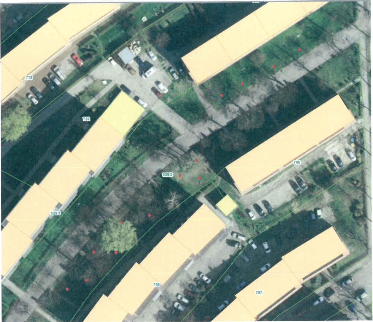
Zdjęcie nr 8